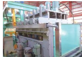
ガラス・セル切削装置